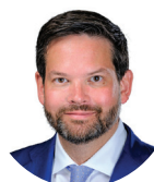
Lukas Mandl, Abgeordneter, Europäisches Parlament